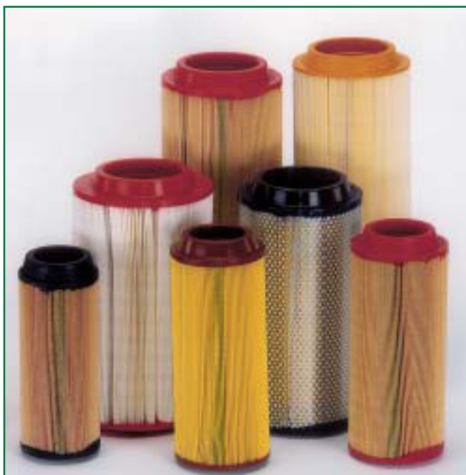
Плохие копии – высокий риск

Фирменные оригинальные продукты всегда копируются пиратами и предлагались по более низкой цене. Но дальновидный оператор системы сжатого воздуха знает, что подделки являются продуктами более низкого качества, которые правильно не устанавливаются, и из-за которых возрастают эксплуатационные расходы, а также экономичная работа системы сжатого воздуха ставится под угрозу. В худшем случае подделка может стать причиной остановки компрессора.